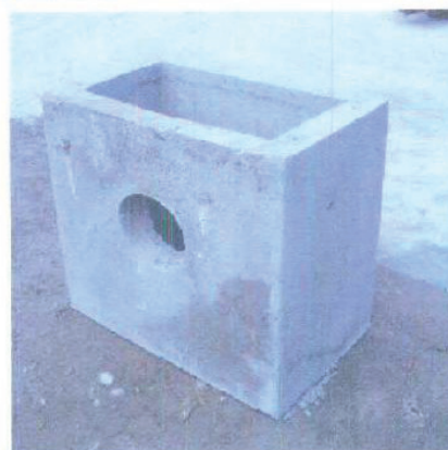
IMBORNAL 600x300x700 C/F